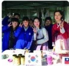
學生籌辦歲末園遊會。