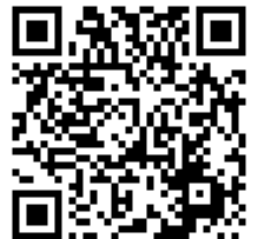
2 「選所愛、好好讀、有前途」 國中適性宣導活動