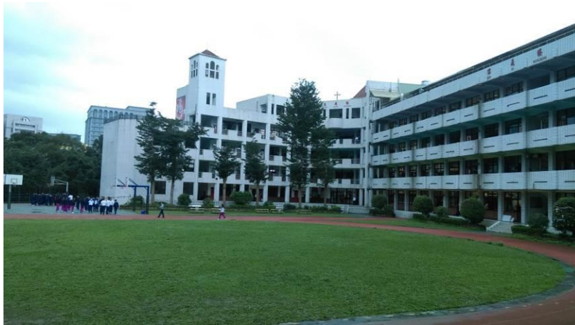
圖(二)飛行競賽場地